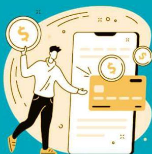
seus hábitos de consumo