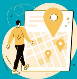
seus hábitos de deslocamento