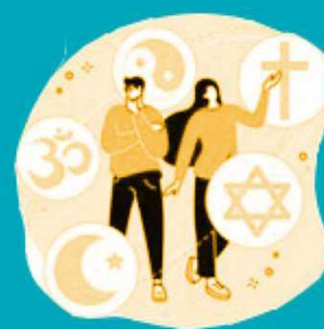
sua preferência religiosa

Agora fica fácil você compreender que o uso mal intencionado desses dados pode criar muitos problemas, como ocorre com os conhecidos golpes de boletos bancários, fraudes em contas de aplicativos, abertura indevida de contas bancárias e de consumo.