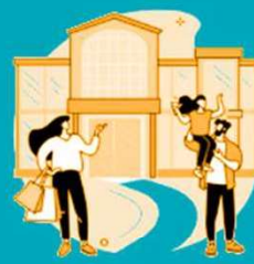
estabelecimento físico / eventos